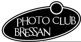
PHOTO CLUB BRESSAN - 4 avenue des Sports - 01000 Bourg-en-Bresse info@photoclubbressan.net - www.photoclubbressan.net Association Loi 1901, affiliée à la Fédération Photographique de France

Conseil d'administration EXCEPTIONNEL du lundi 8 février 2021 Téléréunion par visio, 20h-21h30