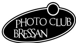
PHOTO CLUB BRESSAN - 4 avenue des Sports - 01000 Bourg-en-Bresse photoclubbressan@gmail.com - www.photoclubbressan.net

Association Loi 1901, affiliée à la Fédération Photographique de France